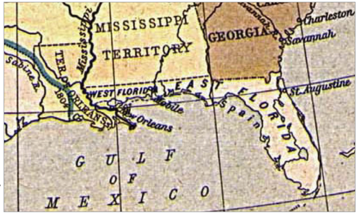
Mapas de las Floridas Oriental y Occidental hacia 1810.