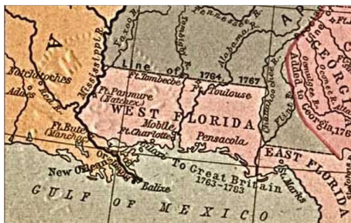
La Florida Occidental hacia 1767.