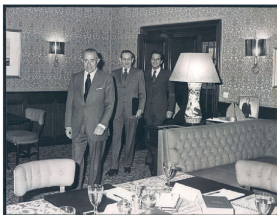
Imagen 2: Carlos Arias Navarro, Torcuato Fernández Miranda y Adolfo Suárez, entrando en una de las reuniones de la Comisión Mixta Gobierno-Consejo Nacional.