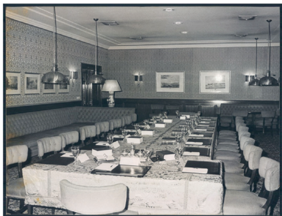
Imagen 1: Sala donde se reunía la Comisión Mixta Gobierno-Consejo Nacional en el palacio de las Cortes.