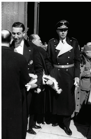
El embajador alemán en Madrid, von Stohrer. Desarrollaba su labor en España desde los tiempos de la Guerra Civil y sería cesado por Ribbentrop al día siguiente de la firma del Acuerdo Comercial hispano-alemán.