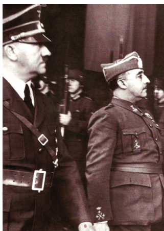
La entrevista de Hendaya. Fue la única ocasión en la que se vieron Franco y Hitler. El alemán consentiría el envío de armamento a España en 1943 para compensar el desequilibrio de la balanza comercial entre ambos países.